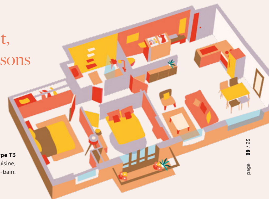
Appartement de type T3 2 chambres, salon, cuisine, salle à manger, salle-de-bain.

Cet appartement, nous en garantissons le caractère d'exception.