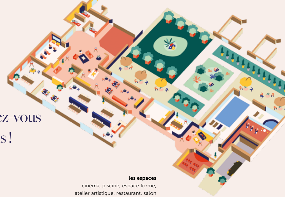
les espaces cinéma, piscine, espace forme, atelier artistique, restaurant, salon