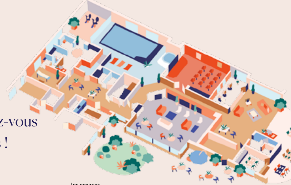
les espaces cinéma, piscine, espace forme, atelier artistique, restaurant, salon