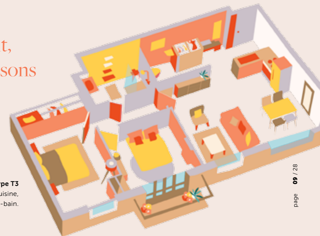
Appartement de type T3 2 chambres, salon, cuisine, salle à manger, salle-de-bain.

Cet appartement, nous en garantissons le caractère d'exception.