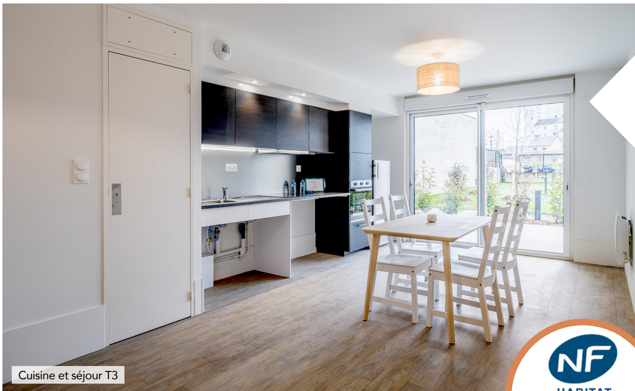
Cuisine et séjour T3