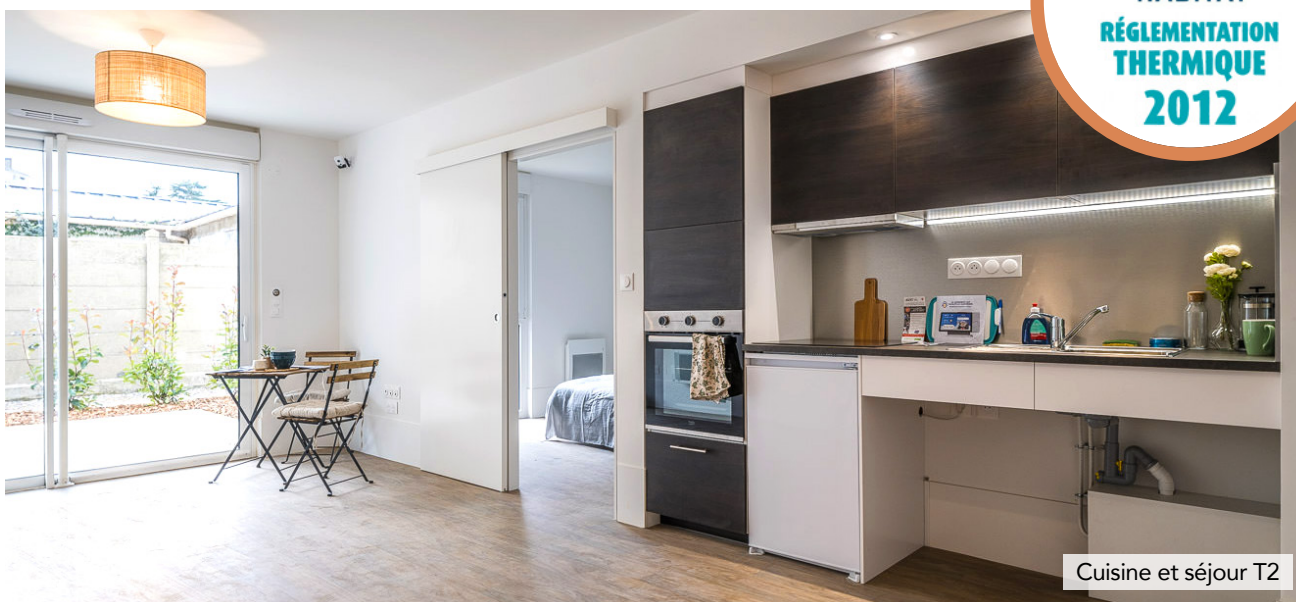
Cuisine et séjour T2