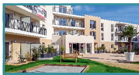
Rezé / 44