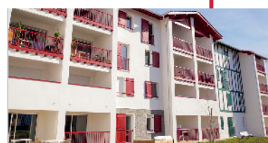
Urrugne / 64