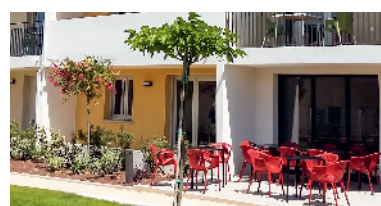
Pézenas / 34