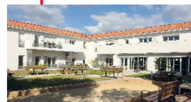
Ollioules / 83