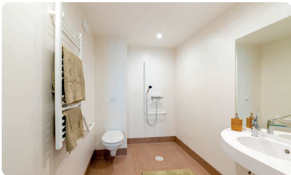
Visuels non contractuels.