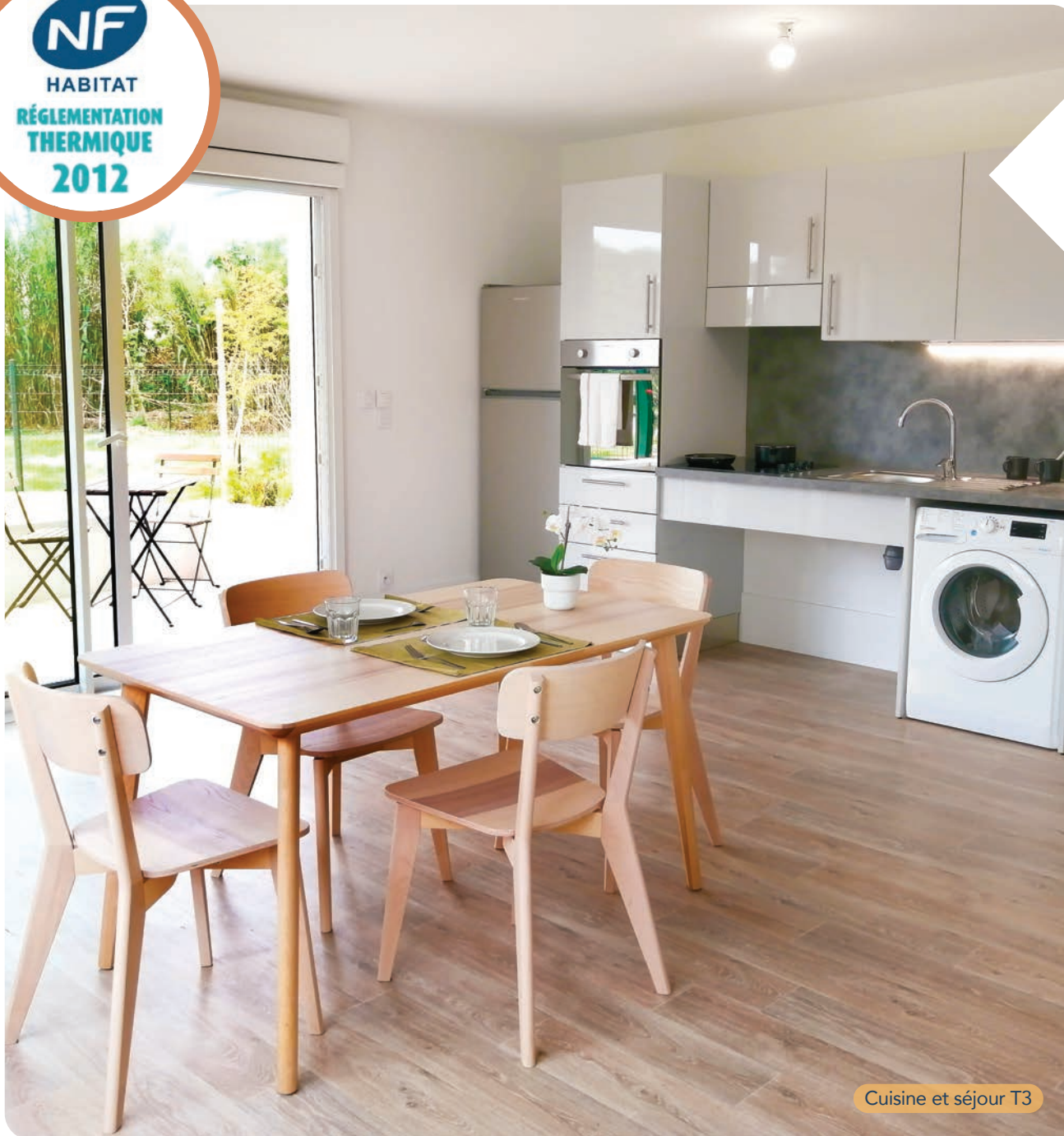
Cuisine et séjour T3