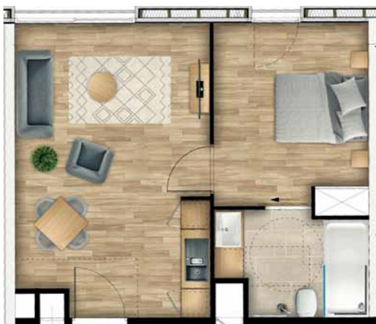
Implantation des T2

LOGEMENTS MEUBLÉS avec possibilité de personnalisation.