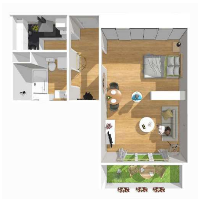
Illustrations d'un logement studio / T1

Du T1 ou T4, les appartements de la résidence sont spacieux et fonctionnels. Ils disposent d'un balcon, d'une cave et pour une majorité d'un emplacement de stationnement*.