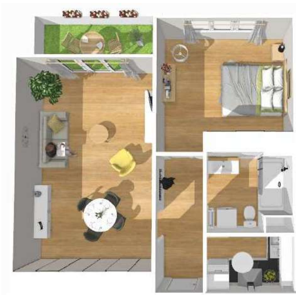
Illustrations d'un logement T2

Du T1 ou T4, les appartements de la résidence sont spacieux et fonctionnels. Ils disposent d'un balcon, d'une cave et pour une majorité d'un emplacement de stationnement*.