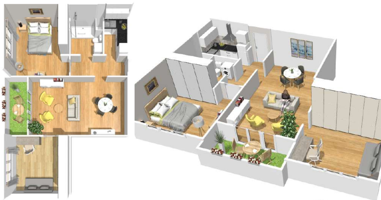
Illustrations d'un logement T3

Du T1 ou T4, les appartements de la résidence sont spacieux et fonctionnels. Ils disposent d'un balcon, d'une cave et pour une majorité d'un emplacement de stationnement*.